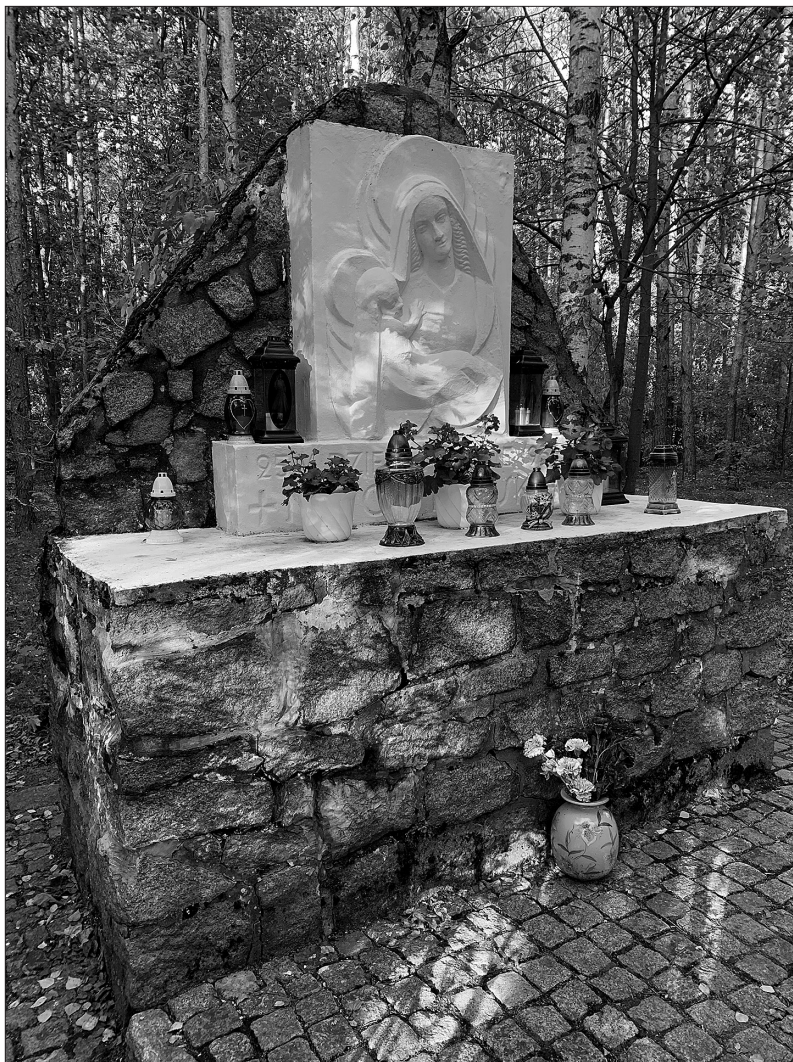
Pomnik Matce Polski