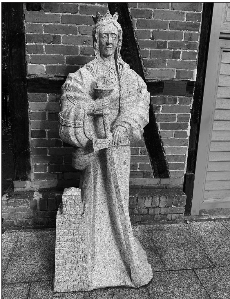
Granitowa figura św. Barbary ustawiona przed kaplicą w lipcu 2019 roku

nych wotów, które znajdowały się w kaplicy w połowie XV wieku, spotykamy między innymi: srebrne wizerunki śledzi, sieci, ryb i statków. W kaplicy krzyżackiego klasztoru nie zabrakło oczywiście relikwii oraz wizerunku św. Barbary.