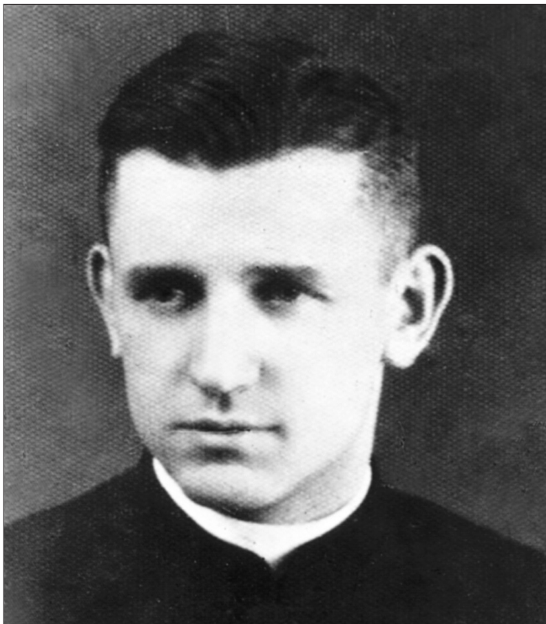
Bł. ks. Stefan Wincenty Frelichowski (1913–1945)