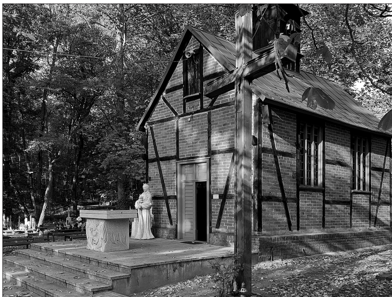
Kaplica na Barbarce wzniesiona w 1842 roku, stan obecny

już w 1829 roku ponownie wzmiankowany jest zły stan budynku kaplicy. W 1835 roku proboszcz parafii Najświętszej Maryi Panny wystąpił do władz miejskich z prośbą o pomoc w renowacji kaplicy i cmentarza, wydaje się, że jednak bez pozytywnego skutku.